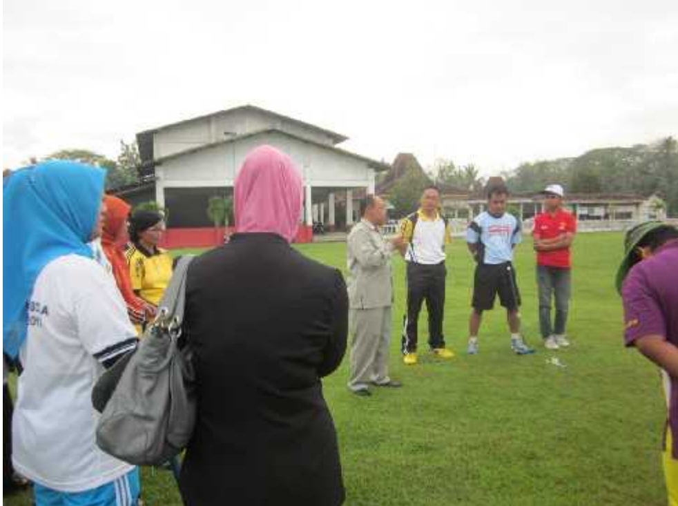
Foto 17. Respon peserta terhadap penjelasan gateball dari Pergatsi