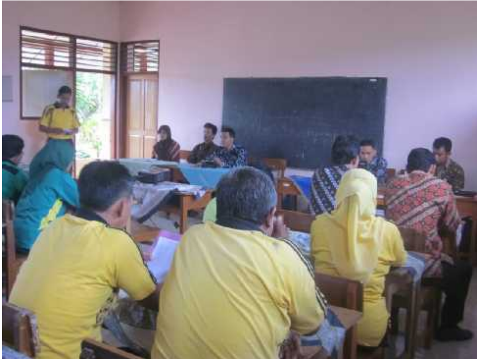
Foto 1. Pembukaan sosialisai olahraga gateball