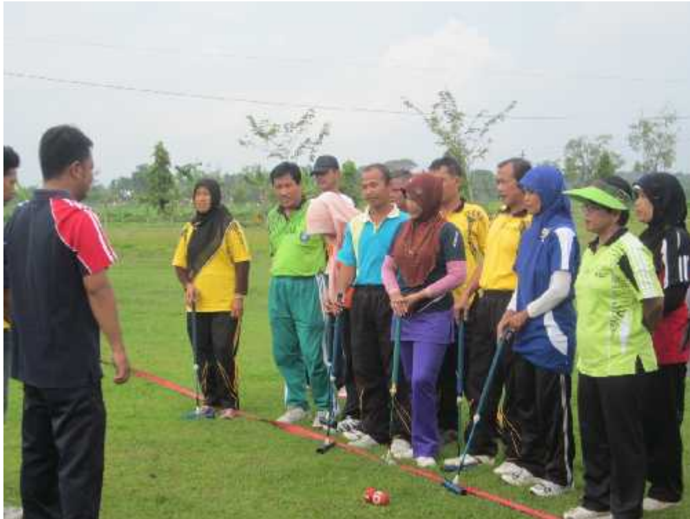
Foto 7. Penjelasan Praktek Gateball