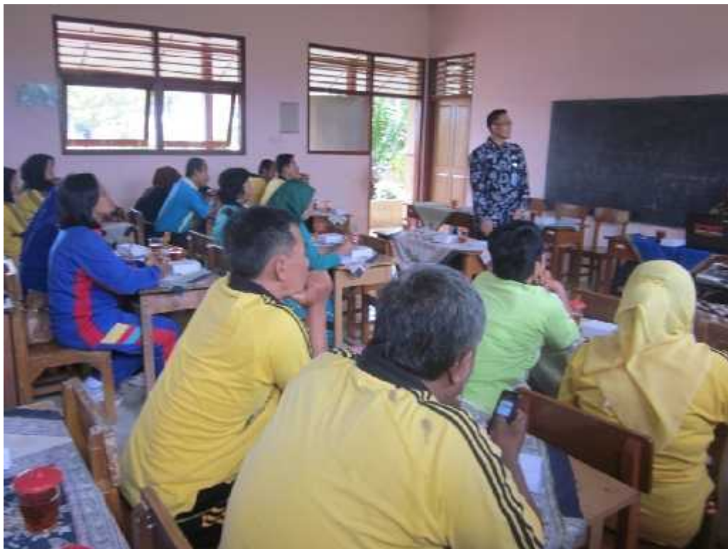
Foto 4. Penjelasan materi