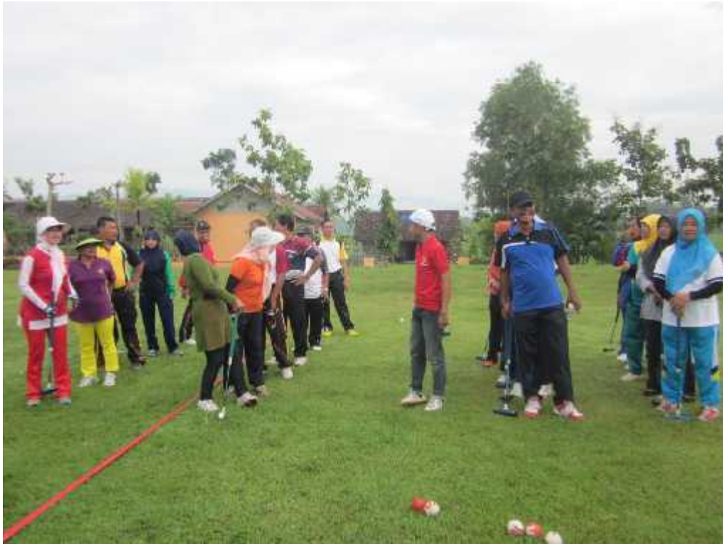
Foto 13. Kelompok Permainan Gateball