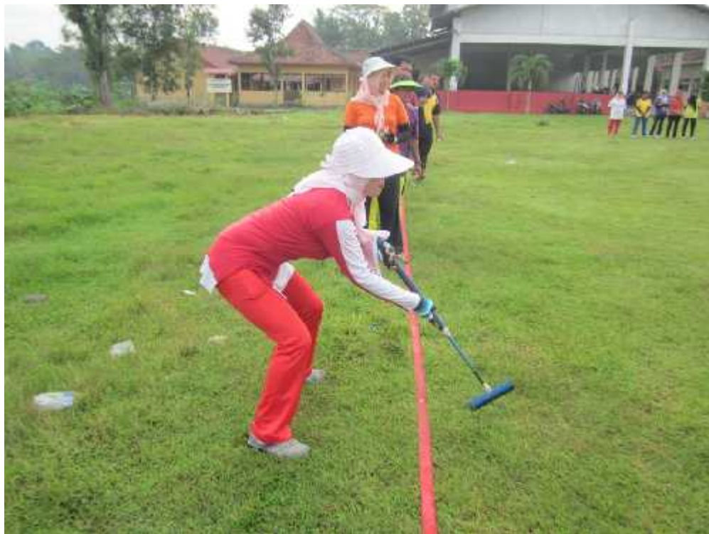
Foto. 14. Peserta setelah memukul bola