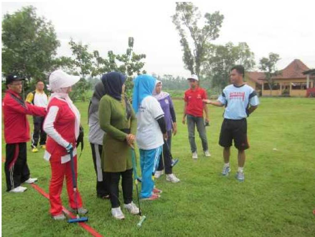
Foto 12. Pembagian Kelompok Permainan