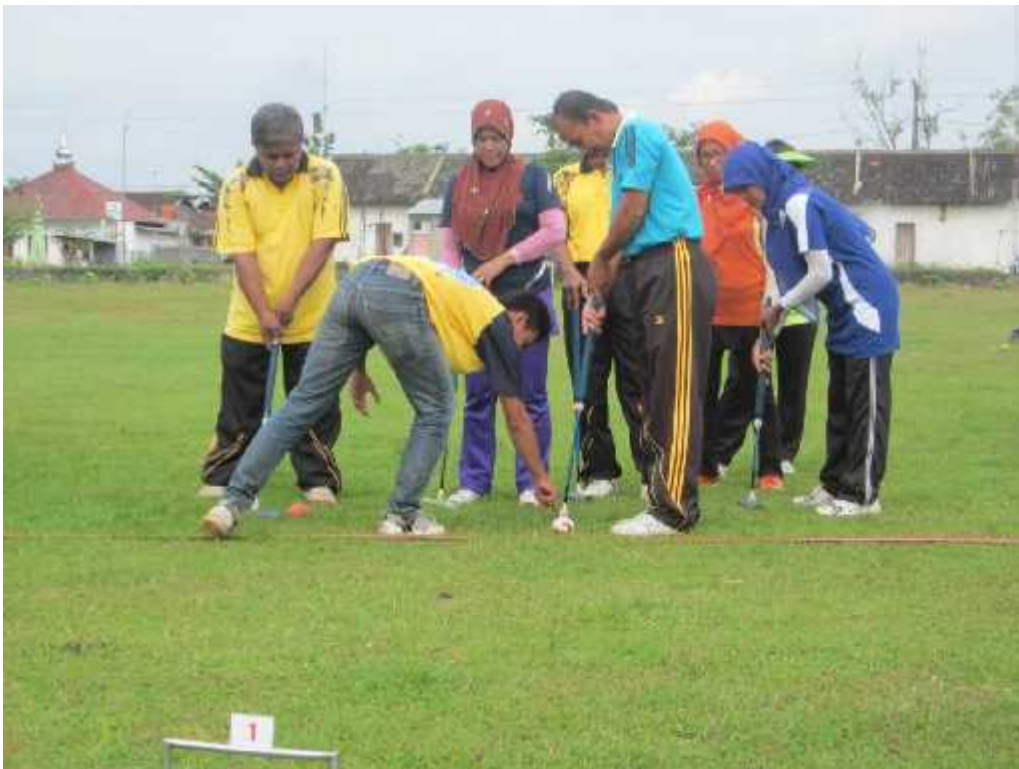
Foto 10. Latihan memukul bola ke gawang