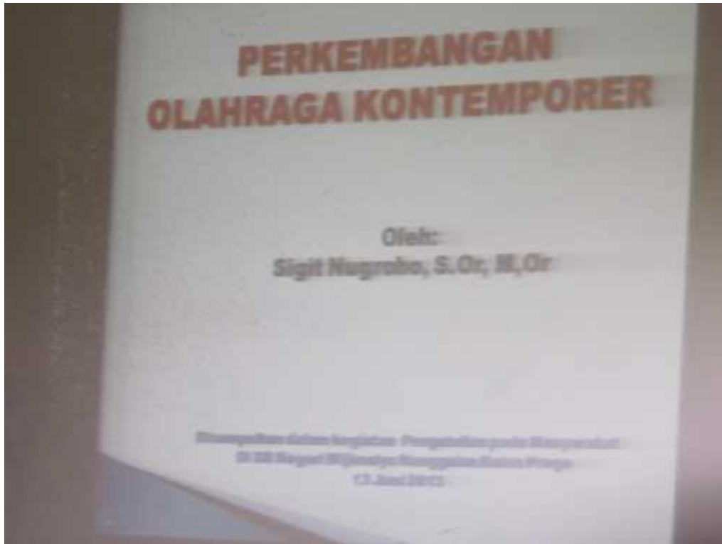
Foto. 3 Materi Olahraga Kontemporer