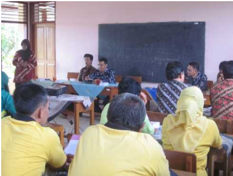
Foto 2. Sambutan Ketua UPTD Nanggulan