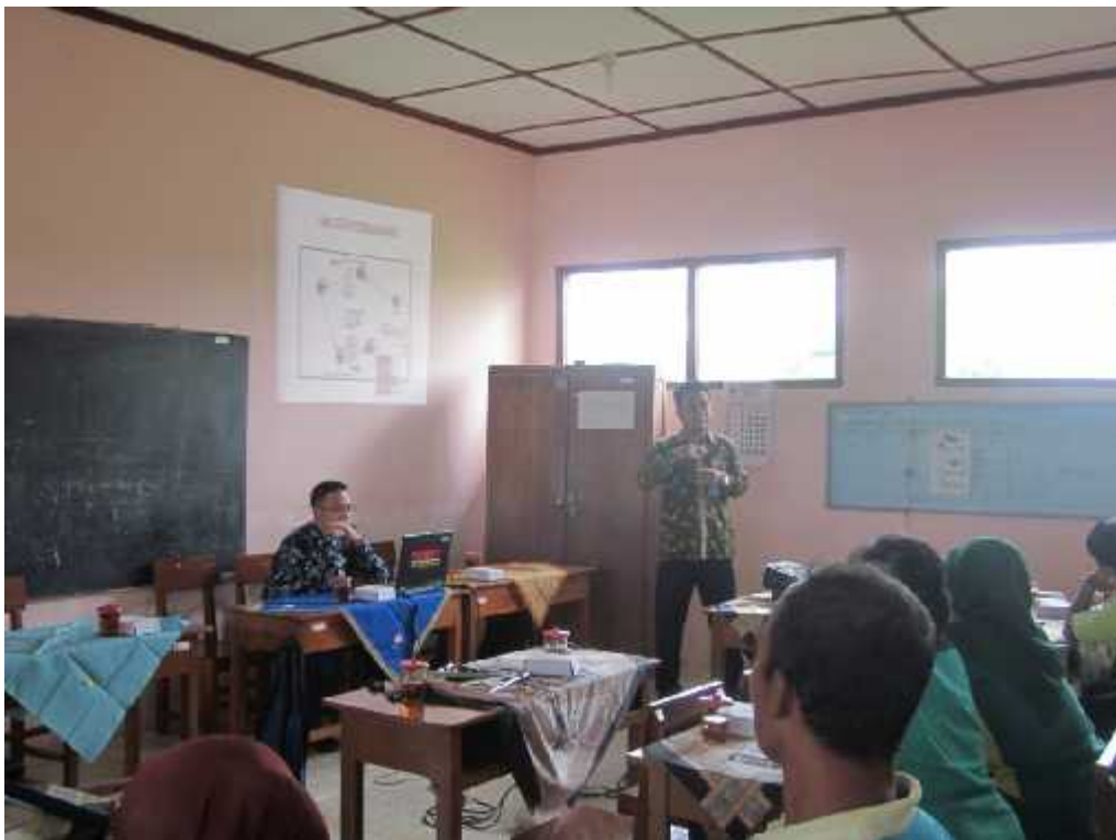
Foto 6. Penjelasan Materi