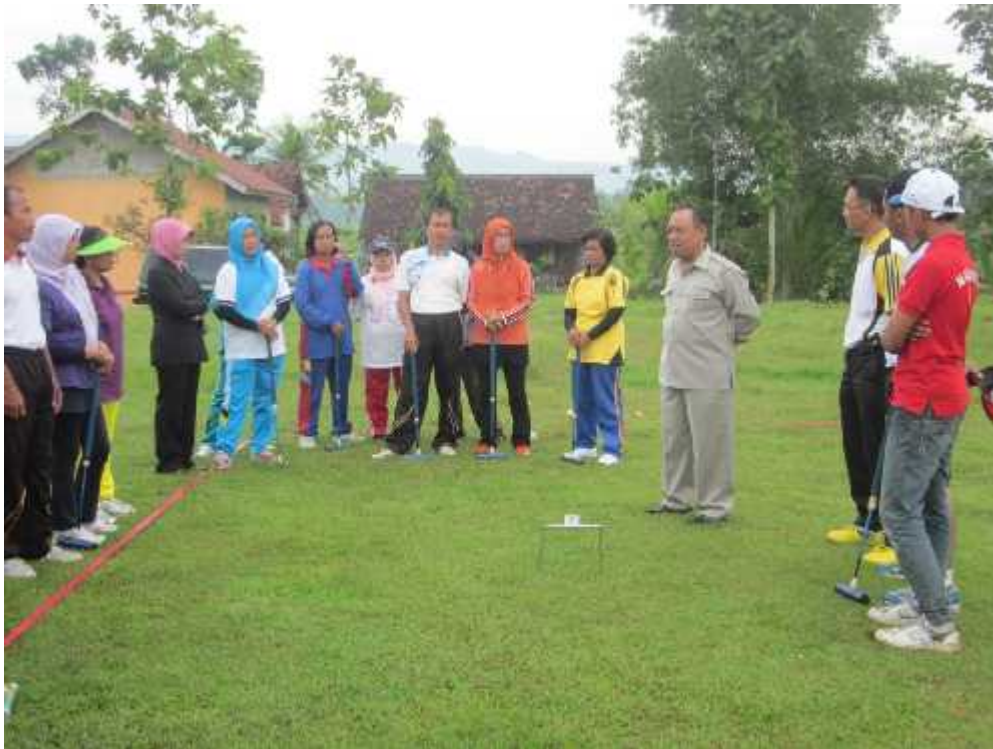
Foto 16. Sambutan dari Ketua Pergatsi Kulonprogo