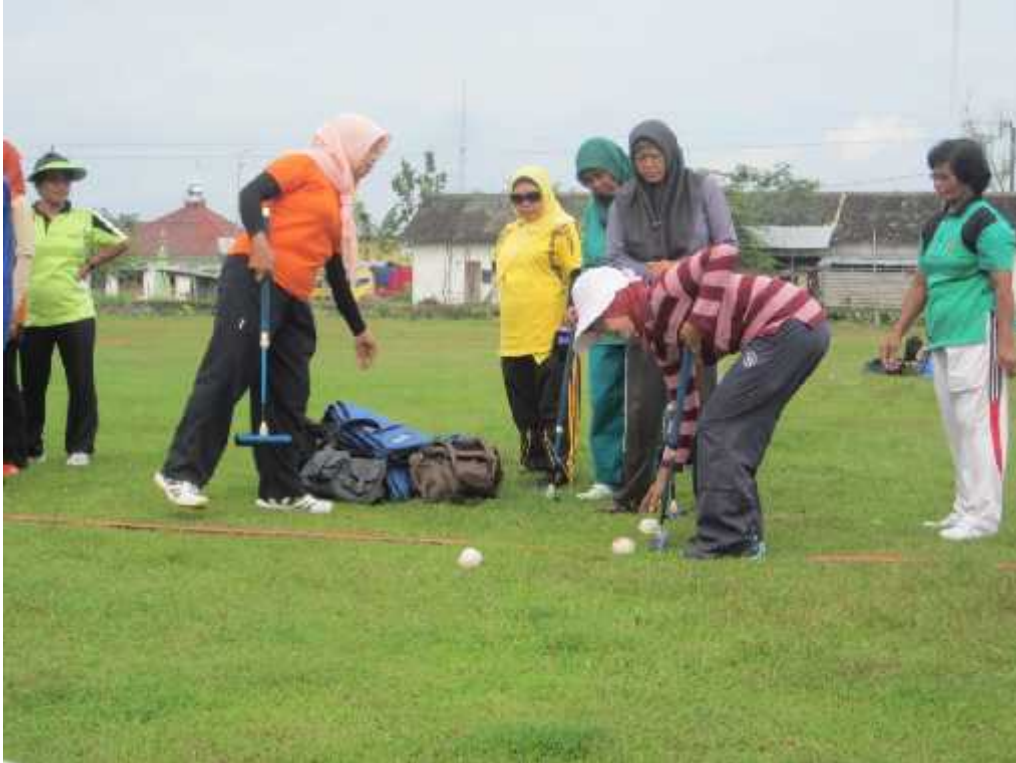
Foto 9. Latihan memukul bola ke bola