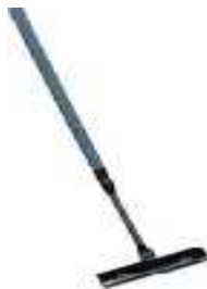
Steak pemukul gateball

Alat yang digunakan pada permainan gateball terdiri dari, steak pemukul bola, bola, gate (gawang sasaran), time (jam gateball), dan line (garis gawang). Adapun jenis dan bentuk alat dan perlengkapan gateball dapat dilihat digambar berikut: