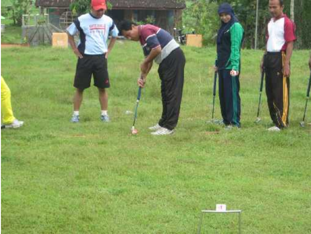
Foto 15. Peserta memukul bola merah ke gate/gawang