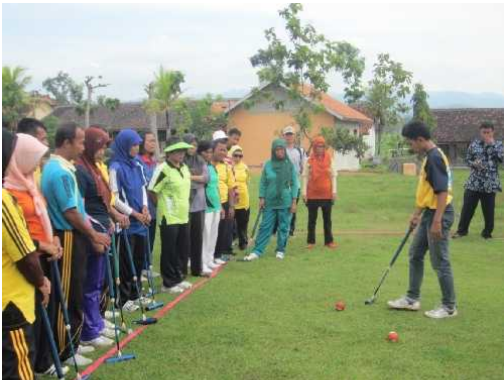
Foto 8. Penjelasan Teknik Pukulan