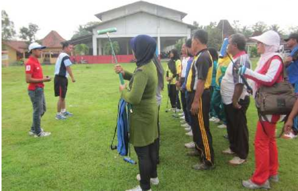
Foto 11. Penjelasan Permainan Gateball