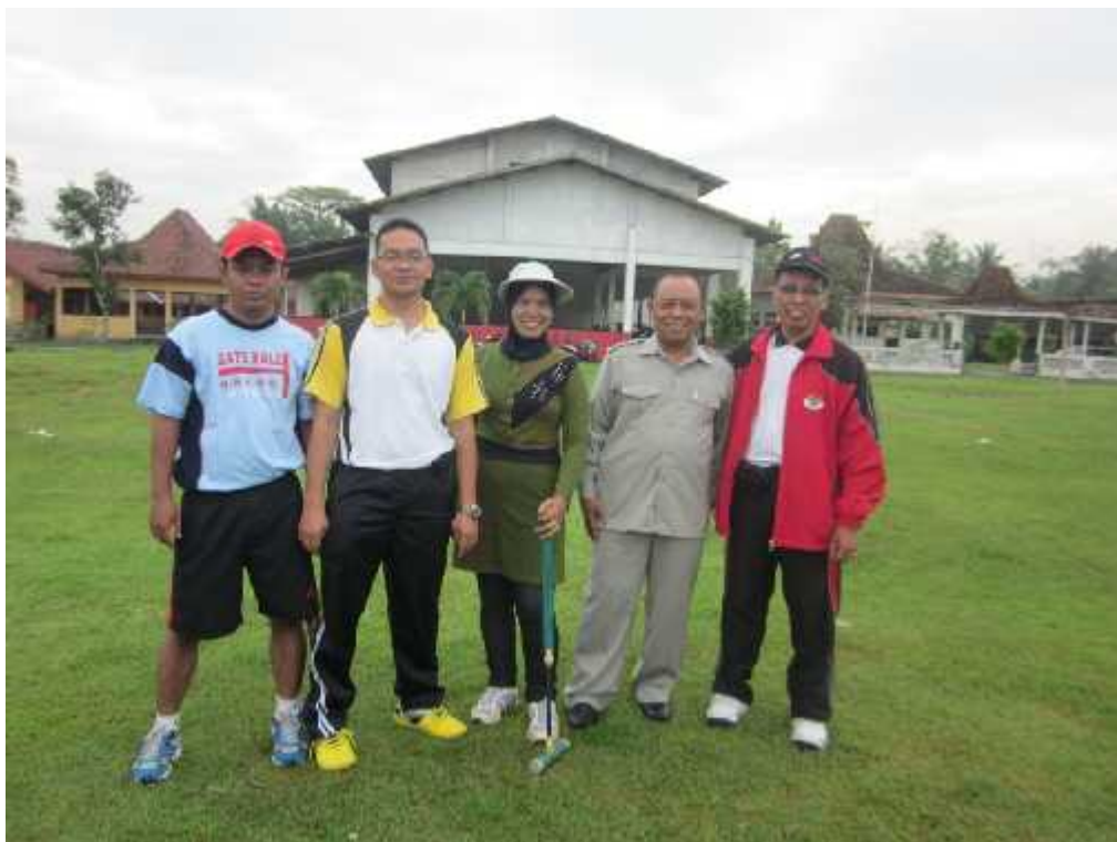
Foto 18. Ketua Pergatsi Kulonprogo, Tim Pengabdian dan Peserta Gateball