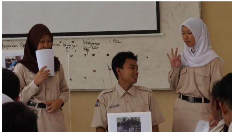
Gambar 2. Praktek Pembelajaran di Kelas Sosiologi

Pada akhir pembelajaran guru pengamat ( observer ) memberi masukan dan komentar terkait proses pembelajaran. Beberapa guru MGMP sosiologi memberi masukan terkait dengan mekanisme presentasi, ketersediaan waktu. Tetapi kebanyakan justru mengaku terinspirasi dengan model pembelajaran yang disajikan. Praktek pembelajaran dengan melibatkan guru dan siswa di kelas merupakan cara baru bagi mereka sehingga mereka merasa ketika pengajaran di kelas masing-masing akan dapat mengembangkan strategi yang sama atau bahkan melakukan variasi dengan strategi yang lain yang disesuaikan dengan karakteristik peserta didik.