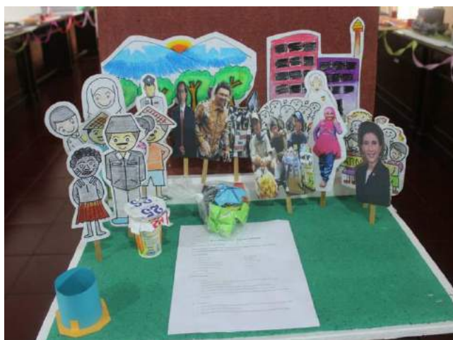
Gambar 1. EcoMedia Wayang Sosiologi