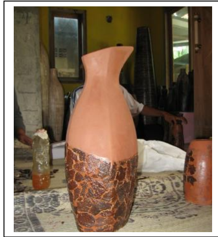
Gambar 2. Produk Keramik dengan Paduan Kulit Salak

melalui web. Dengan demikian secara keseluruhan tujuan kegiatan pengabdian ini untuk menerapkan teknologi pemanfaatan kulit salak pada produk keramik dan memperkenalkan desain keramik yang menarik dapat terlaksana dengan baik.