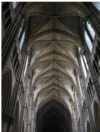
Gambar 3. Clerestory Cathedral Rheims

Kemajuan Romawi di bidang interior dan arsitektur selain dapat dilihat dari kemegahan dan kemewahan bangunan-bangunannya juga dari sistem peratapannya yang sangat hebat, merupakan kombinasi antara lengkung sejati ( true vault ) dan lengkung silang ( cross barrel vault ). Struktur cross vault yang dimulai di jaman Romawi berbuah luar biasa di jaman Gotik. Karena kehebatan konstruksinya, gereja Gotik berani membuka clerestory berdinding kaca sehingga menjadi terang.