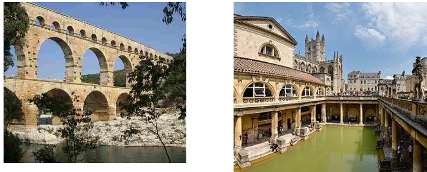
Gambar 2. Aquaduct dan Thermae

Kemajuan Romawi di bidang interior dan arsitektur selain dapat dilihat dari kemegahan dan kemewahan bangunan-bangunannya juga dari sistem peratapannya yang sangat hebat, merupakan kombinasi antara lengkung sejati ( true vault ) dan lengkung silang ( cross barrel vault ). Struktur cross vault yang dimulai di jaman Romawi berbuah luar biasa di jaman Gotik. Karena kehebatan konstruksinya, gereja Gotik berani membuka clerestory berdinding kaca sehingga menjadi terang.