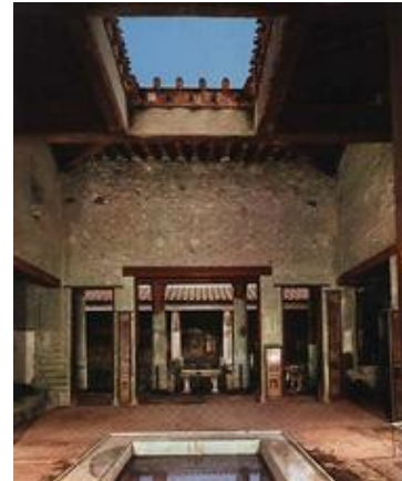
Gambar 4. Atrium dan Impluvium

Rumah bagi bangsa Romawi merupakan pusat kehidupan, sehingga dibuat begitu indah dan mewah, berbeda dengan peradaban Mesir dan Yunani yang tidak begitu memberikan perhatian yang besar kepada keindahan ruang huniannya, karena keasyikan mereka dengan life after death atau kehidupan setelah mati.