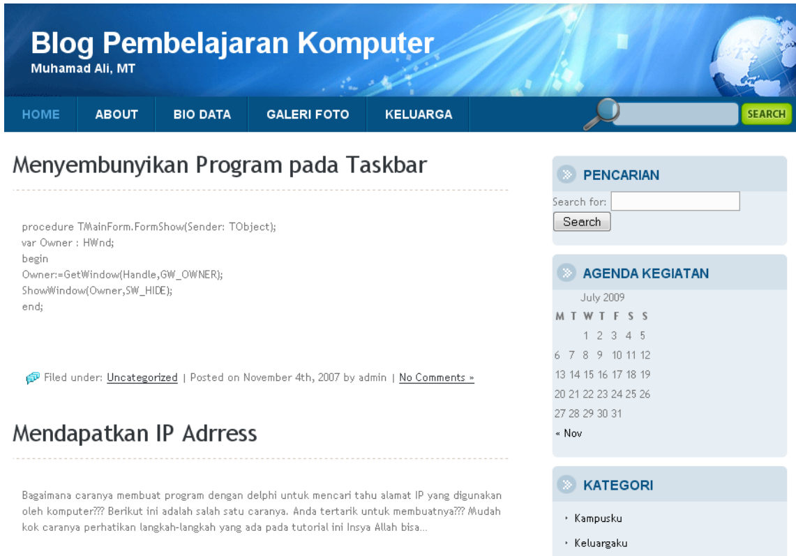
Gambar 1. Contoh tampilan blog