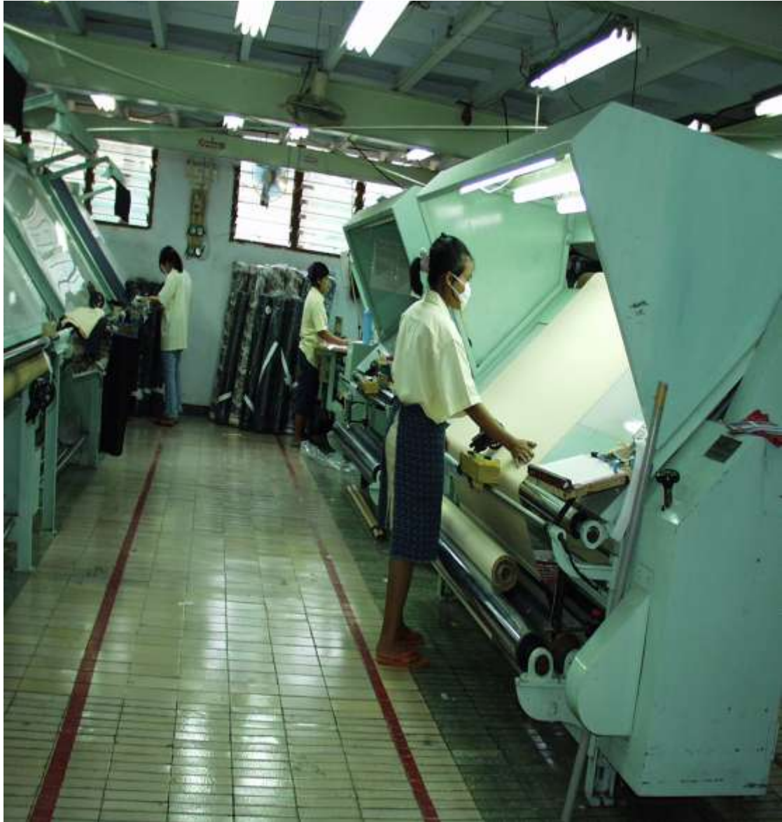
Gambar Mesin Pemeriksa Kain ( Fabric Inspection Machine )