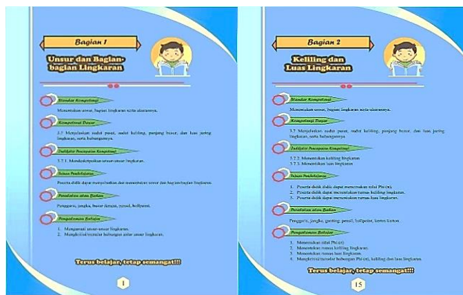
Gambar 2. Subcover materi lingkaran

sehari-hari yang berkaitan dengan lingkaran, hal ini bertujuan untuk menunjukkan kepada siswa bahwa materi lingkaran sangat banyak digunakan dalam kehidupan sehari-hari.