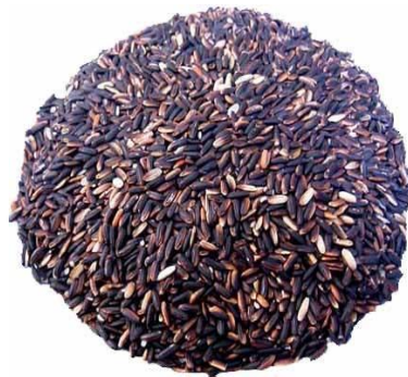
Gambar 1. Beras hitam

Beras hitam ( Oryza sativa L. indica ) merupakan salah satu varietas beras langka yang mempunyai pigmen ungu tua dan banyak dibudidayakan di Asia Selatan dan Cina. Di Pulau Jawa, padi hitam banyak dibudidayakan di daerah Surakarta, Wonosobo, Temanggung, Bantul, dan Sleman, sedangkan di luar Pulau Jawa terdapat di daerah Kendari, Gowa, Pantar, dan Alor. Padi hitam dapat dibudidayakan di daerah dengan ketinggian lebih dari 500 meter di atas permukaan laut dan batangnya dapat mencapai tinggi lebih dari 1 meter pada umur 6 bulan. Padi hitam dapat dipanen setelah berumur 150 hari atau 5 bulan.