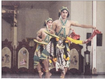
Gambar 4. Beksan Tanjak Panggel

diri sendiri apabila ada musuh yang akan menusuk atau menghantam. Properti tameng harus dibawakan dengan baik oleh seorang penari. Oleh karena tameng merupakan penggambaran dari sebuah senjata, maka ragam gerak tanjak panggell ini akan kelihatan indah dan harmonis apabila seorang penari mampu membawakannya dengan benar, trampil, kuat, luwes, dan berani sesuai dengan aturan-aturan yang diterapkan di Pura Pakualaman.