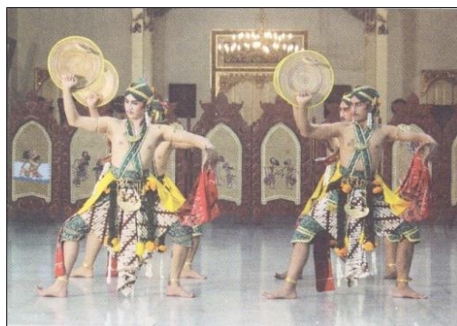
Gambar 3. Beksan Tanjak Giro

beksan Tanjak Giro hanya terdapat pada beksan Bandabaya. Ragam ini memiliki keunikan tersendiri yang tidak ada di tari yang lain. Ragam beksan Tanjak Giro akan kelihatan berwibawa dan agung apabila sipenari tepat dalam melakukan gerakan tersebut. Dengan properti Tameng dan Pedang tarian ini tidak mudah untuk dilakukan, tetapi dengan adanya tanggung jawab dan mengikuti aturan-aturan yang sudah ditentukan, maka seseorang yang menarikan gerakan-gerakan dalam ragam Tanjak Giro akan kelihatan indah dan harmonis.