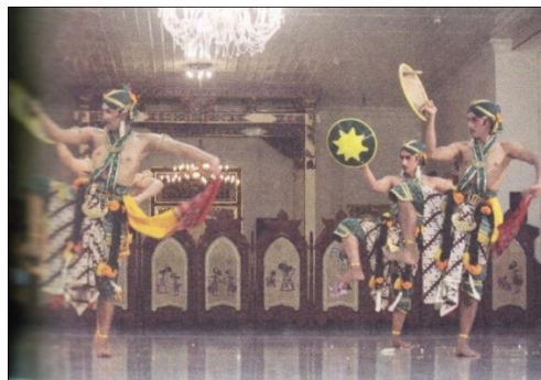
Gambar 5. Beksan Tanjak Bapang

Ragam beksan tanjak bapang ini merupakan gerakan-gerakan yang kuat dan trampil dengan menggunakan permainan tameng. Kelincahan dan keharmonisan yang terlihat pada beksan tanjak bapang ini terletak pada ketrampilan memainkan tameng dan angkatan kaki sesuai dengan aturan-aturan yang telah diterapkan. Seorang penari akan kelihatan gagah dan tangkas apabila mampu melakukan gerakan ini dengan benar, kuat, luwes, berani, dan tepat serta tangkas.