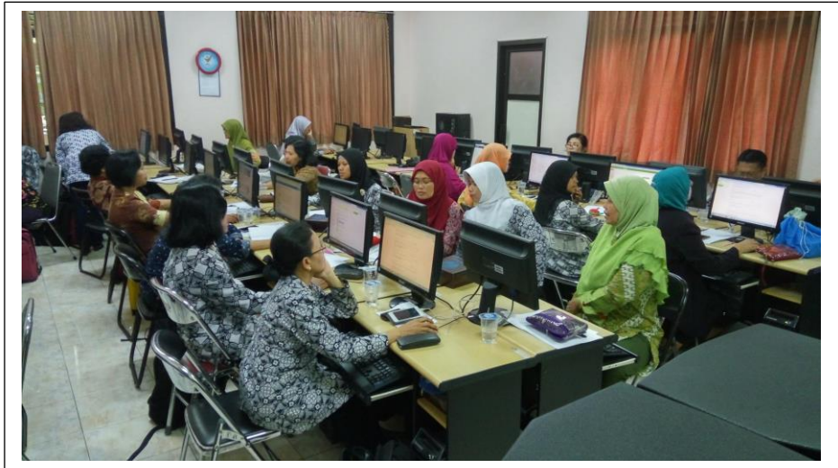
Foto Kegiatan PPM