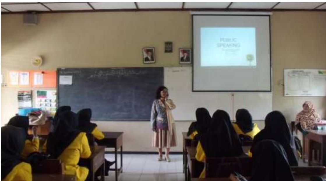
Gambar 2. Penyampaian materi pelatihan

Hasil evaluasi terhadap pelaksanaan program pelatihan keterampilan dasar berkomunikasi, diuraikan menurut komponen-komponen evaluasi dengan model Kirkpatrick. Pada komponen Reaction , hasil wawancara menunjukkan bahwa semua informan menyatakan program pelatihan sangat positif, karena mendukung kompetensi siswa. Disamping itu peserta juga menyatakan pelatihan sudah sesuai dengan kebutuhan, yaitu agar para siswa memiliki rujukan prinsip-prinsip dasar untuk diterapkan dalam berkomunikasi. Latar belakang dibutuhkannya pelatihan adalah bahwa program dimaksudkan untuk mengatasi permasalahan yaitu seringkali terjadi komunikasi antarwarga sekolah tidak sesuai dengan prinsip dasar norma sopan-santun dan etika. Selanjutnya peserta pelatihan berpendapat materi pelatihan disampaikan dengan metode yang menarik. Hal ini juga dapat dikonfirmasi dengan hasil pengamatan, bahwa semua siswa mengikuti pelatihan secara penuh.