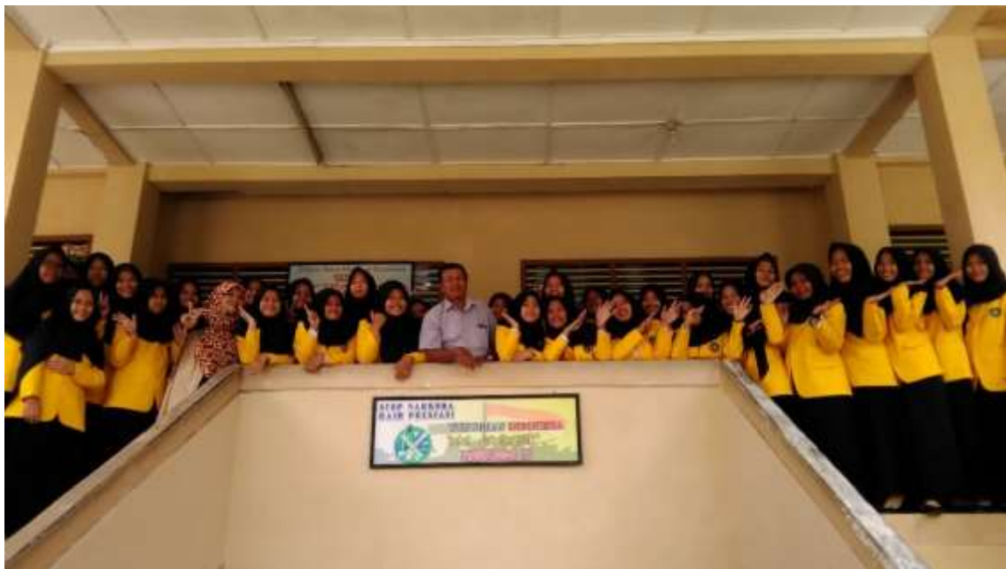
Gambar 3. Foto bersama tutor dan peserta pelatihan

Evaluasi pada komponen Result , mengindikasikan bahwa dampak pelatihan dapat diterapkan dalam kehidupan sehari-hari, khususnya bagi siswa dalam berkomunikasi, menyiapkan diri pada uji kompetensi, dan diharapkan dapat digunakan pada saat sudah terjun di dunia kerja. Berdasar hasil wawancara, dapat dideskripsikan nilai-nilai etika komunikasi sudah dapat dipahami dan diterapkan dalam kehidupan sehari-hari.