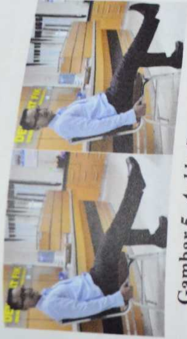
Gambar 5. Ankle flex and stretch