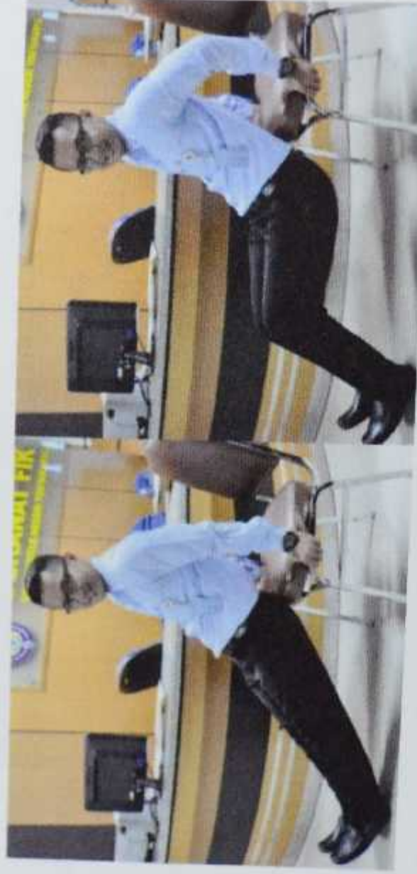
Gambar 7. Bench dips