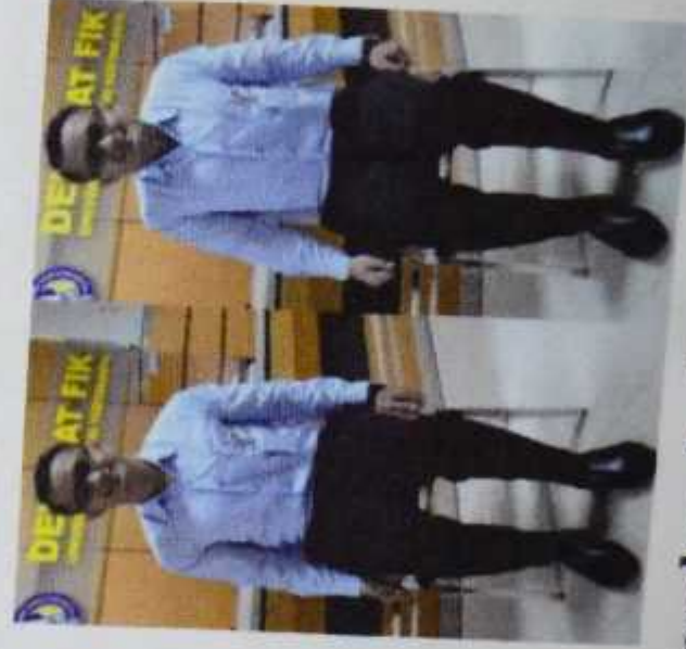
Gambar 2. Shoulder shrug