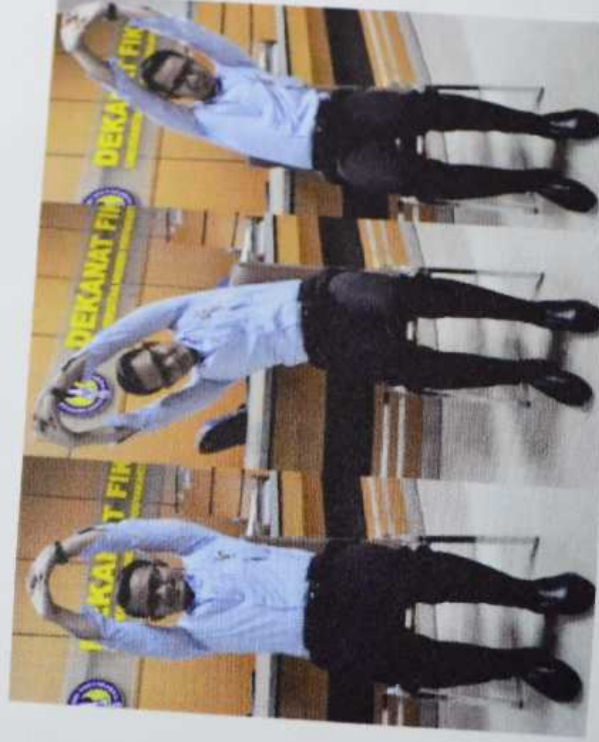
Gambar 3. Back side-stretch