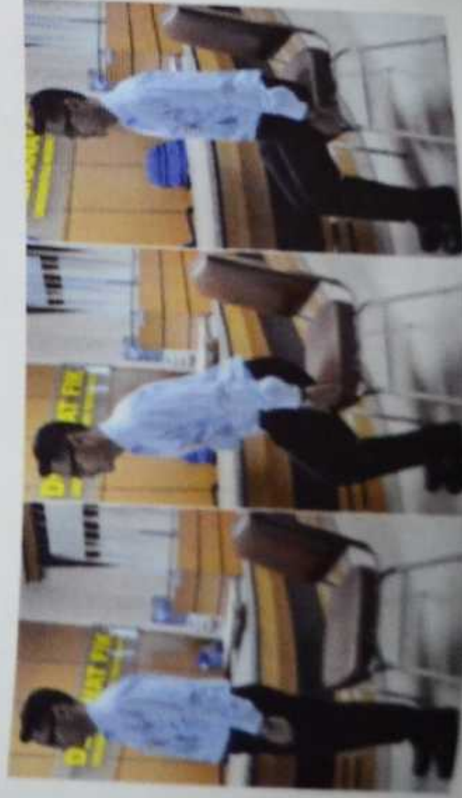
Gambar 6. Leg squats