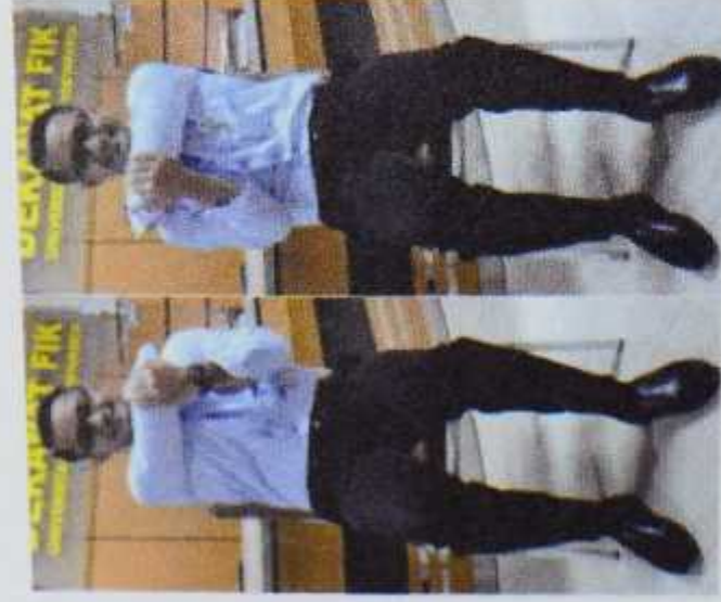
Gambar 4. Middle back stretch