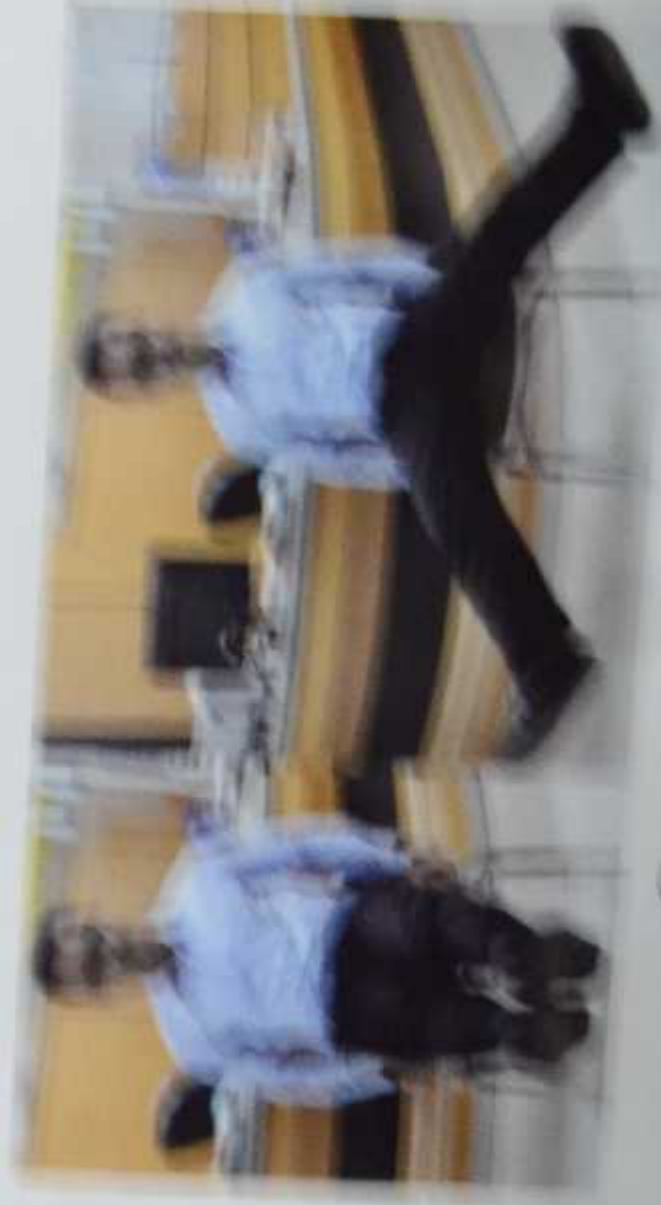
Gambar 10. Side step