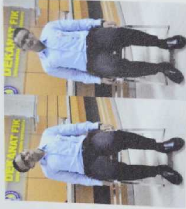
Gambar 1. Side neck stretches