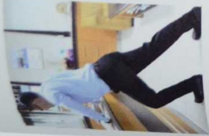
Gambar 8. Push up