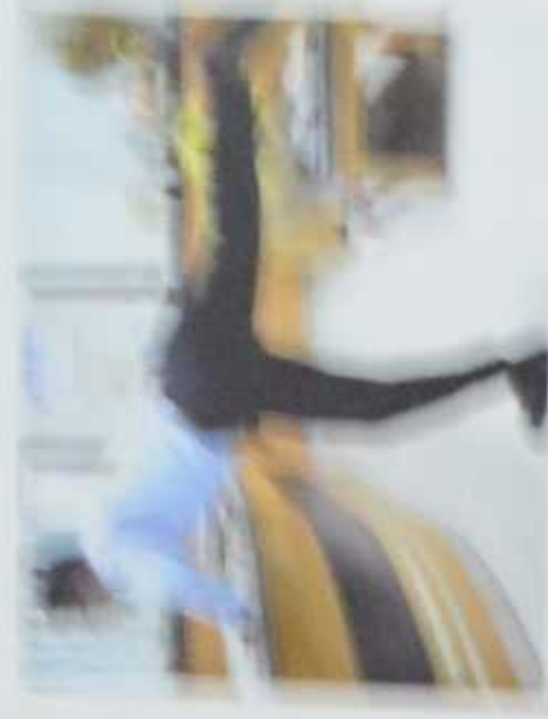
Gambar 9. Aircraft pose

Gerakan kaki dan tangan yang dilakukan secara bergantian.