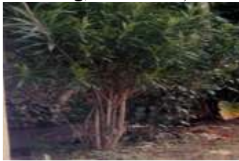
Gambar 1. Tumbuhan Suji ( Pleomele Angustifolia )

Di daerah pulau Jawa, tumbuhan suji sudah sangat dikenal masyarakat sebagai zat pewarna makanan yaitu yang diambil dari air remasan daunnya (ekstrak warna daun suji). Sedangkan di beberapa daerah di luar pulau Jawa, tumbuhan ini dimanfaatkan sebagai bahan obat-obatan dan kecantikan. Di sisi lain yang sampai saat ini belum banyak diketahui masyarakat adalah kandungan serat yang ada di dalam daun tumbuhan suji yang berpotensi untuk dapat dimanfaatkan sebagai bahan baku alternatif tekstil, sehingga perlu dikembangkan dan lebih dibudidayakan untuk meningkatkan pendapatan masyarakat.