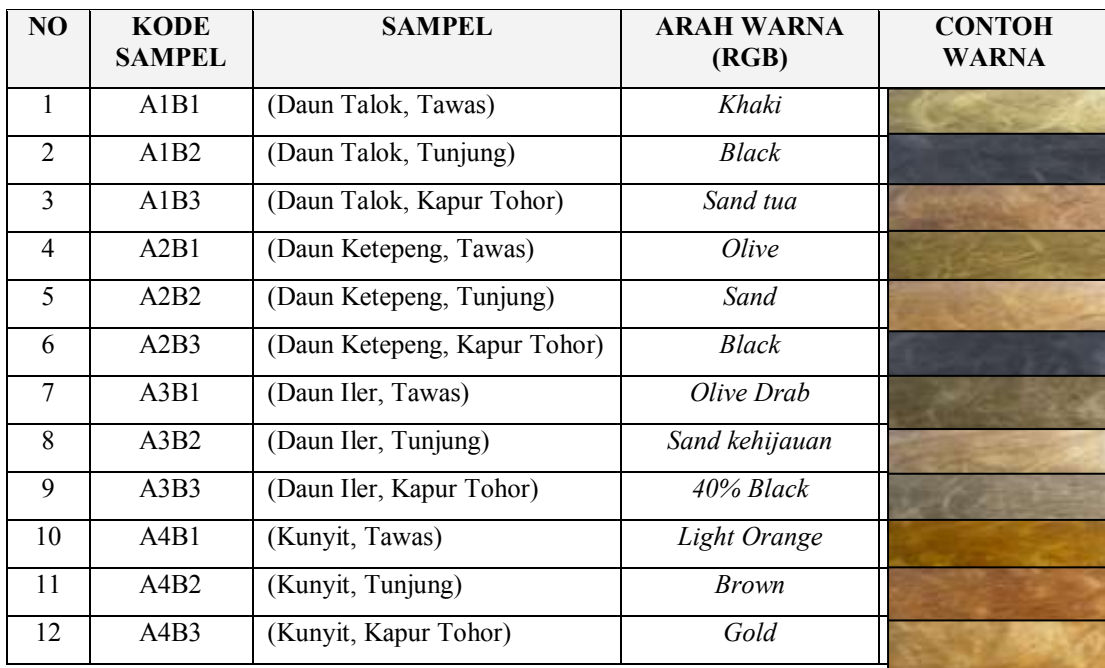
Tabel 3. Arah Warna Hasil Eksperimentasi Proses Pencelupan

Arah warna hasil pewarnaan ini secara jelas dapat dilihat pada Tabel 3. Tabel 3 menunjukkan bahwa dari 12 variasi (4 jenis zat warna dan 3 jenis zat fiksasi), dapat menghasilkan 12 jenis arah warna yang berbeda. Hal ini menunjukkan bahwa dari jenis zat warna yang sama tapi dengan jenis zat fiksasi yang berbeda akan menghasilkan warna yang berbeda. Dengan demikian berarti jenis zat fiksasi bertindak sebagai zat pemberi arah warna.