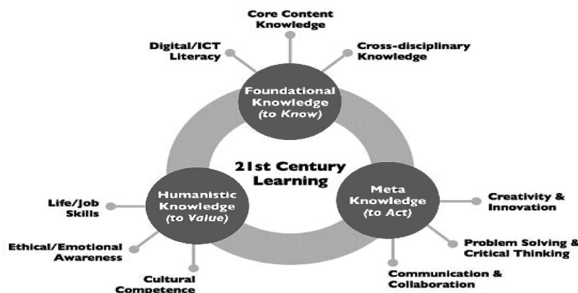
Gambar 1. Kompetensi Abad XXI