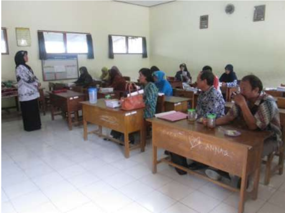
Gambar 15. Salah Satu Peserta Pelatihan Menyampaikan Terima Kasih Serta Memberikan Kesan dan Pesan Terhadap Tim Pengabdi