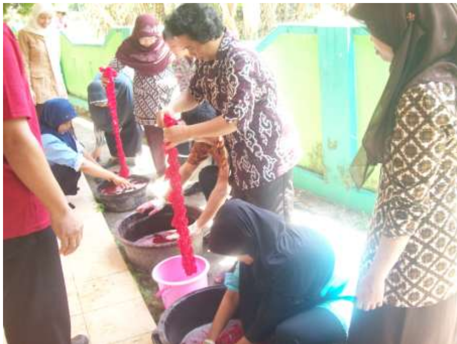
Gambar 10. Para Peserta Pelatihan Mempraktekkan Proses Pewarnaan Kain Teknik Celup