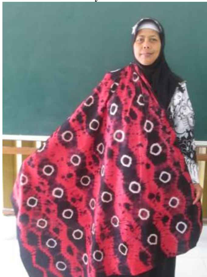
Gambar 14. Salah Satu Peserta Pelatihan Berpose dengan Batik