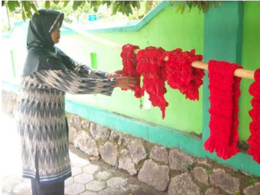
Gambar 11. Salah Satu Peserta Pelatihan Mempraktekkan Proses Penirisan Kain Setelah Diwarna