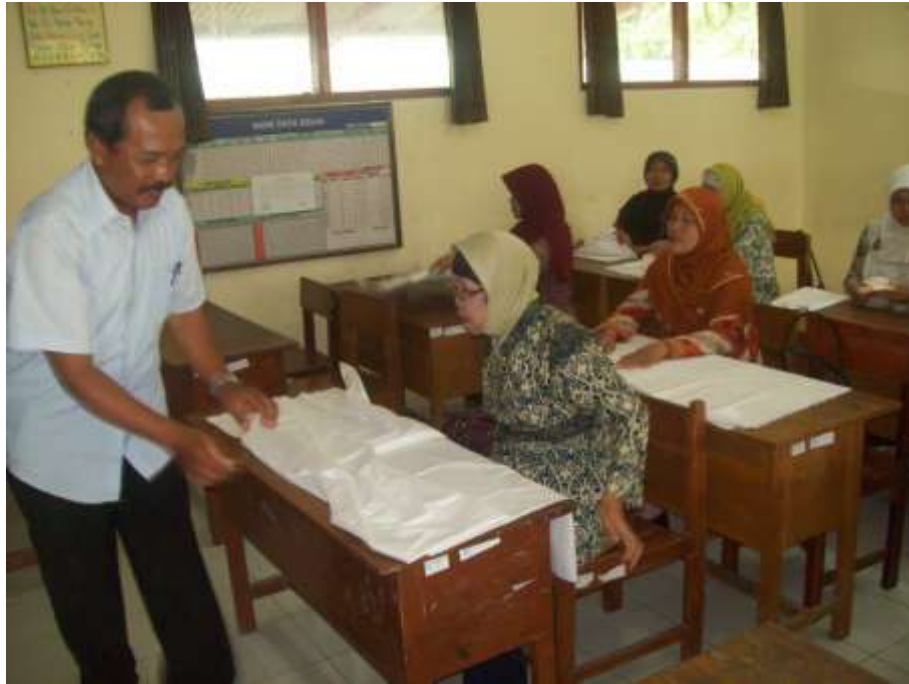
Gambar 3. Ketua Tim Pengabdi Mendemonstrasikan Membuat Pola pada Kain