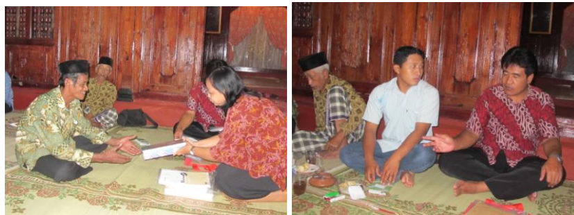
Gb. Penyerahan peralatan perkantoran sebagai stimulan dan saat anggota kelompok berdialog dengan salah seorang anggota tim PPM

Kegiatan pendidikan pelatihan dikatakan berhasil apabila para peserta pelatihan terjadi proses transformasi pengetahuan. Proses transformasi dapat dikatakan baik apabila terjadi dua hal, yaitu peningkatan kemampuan dalam melaksanakan tugas dan perubahan sikap perilaku yang tercermin dalam sikap, disiplin dan etos kerja dalam kelompok. Evaluasi proses juga diterapkan oleh Tim PPM terutama pada saat pola pendampingan dalam beberapa kali pertemuan kelompok tukang khususnya pada saat melakukan praktek manajemen usaha dan administrasi keuangan secara mandiri maupun kelompok.