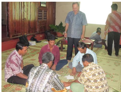
Gb. Permainan kelompok untuk menemukan nilai kejujuran, keterbukaan dan saling membantu dalam sebuah organisasi

Pada hari kedua, kepada para peserta pelatihan ini diberikan pembekalan pengetahuan tentang keterampilan melakukan identifikasi penilaian dan kebutuhan atas potensi, masalah dan belajar dalam berorganisasi. Bentuk penyampaian ini diberikan dengan model ceramah bervariasi serta dilengkapi tanya jawab dan praktek melakukan identifikasi kebutuhan belajar secara berkelompok. Pada hari yang sama, tim PPM menyampaikan materi yang berkaitan dengan peningkatan kemampuan dan keterampilan melakukan pengelolaan dan manajemen administrasi keuangan. Penyampaian materi juga disajikan secara tutorial dengan metode permainan, curah pendapat dan praktek melakukan pembukuan, penyusunan rencana usaha bersama dan bentuk-bentuk manajemen lain dengan menggunakan dinamika kelompok.