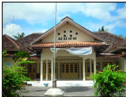
Gb. 1 Kantor Kelurahan Desa Gilangharjo