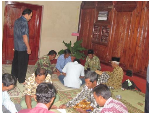
Gb. Proses pembelajaran dengan metode permainan dan dinamika kelompok untuk menemukan nilai kerjasama dalam sebuah organisasi

Pelaksanaan pengabdian pada masyarakat di desa Gilangharjo khususnya bagi kelompok tukang bangunan dilakukan pada tanggal 29 dan 30 Juli 2011 dengan menghadirkan semua pengurus dan anggota kelompok tukang bangunan yang tergabung dalam sebuah organisasi atau paguyuban sebanyak 18 orang laki-laki dewasa. Kegiatan dilakukan di rumah tinggal salah seorang tim PPM selama 2 hari dengan menggunakan metode tutorial dan dilengkapi berbagai teknik, curah pendapat, diskusi, tanya jawab serta disertai bentuk permainan.