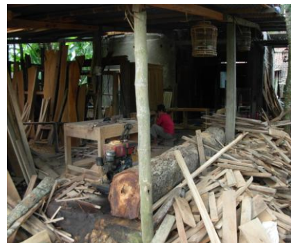
Gb. 2 Aktivitas Buruh Bangunan/Tukang di Desa Gilangharjo