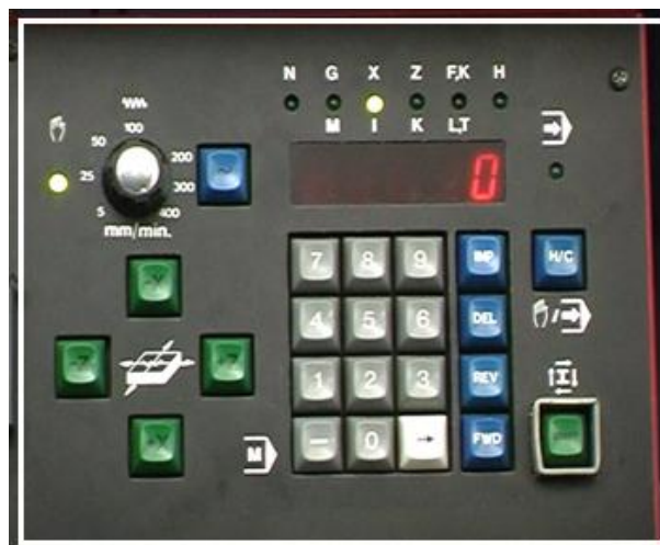
Gambar 1. Tombol-tombol kendali mesin TU-2A