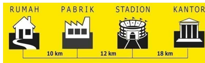
Gambar1. Skema metode Inkremental

Adalah suatu metode pemrograman dimana titik referensinya selalu berubah, yaitu titik terakhir yang dituju menjadi titik referensi baru untuk ukuran berikutnya. Untuk lebih jelasnya lihat gambar berikut ini :