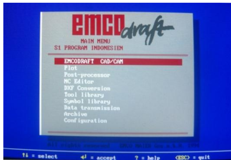
Gambar 1. Tampilan Menu Utama

Menu utama terdiri dari beberapa menu pilihan yang dapat dipilih, diantaranya dapat diterangkan pada gambar 1 berikut: