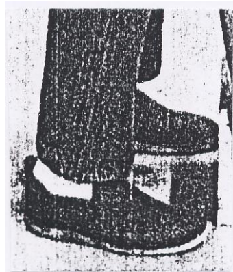
Gbr 2. Sepatu Kerja

Sepatu yang dikenakan oleh operator harus benar-benar dapat memberikan perlindungan terhadap kaki operator. Berdasarkan standart yang telah ditentukan bahwa sepatu kerja dibuat dari bahan kulit, sedangkan alas dibuat dari karet yang elastis tetapi tidak mudah rusak karena berinteraksi dengan minyak pelumas (oli) dan biasanya untuk bagian ujung masih dilapisi oleh plat besi yang digunakan untuk melindungi kaki apabila terjatuh oleh benda-benda yang berat.