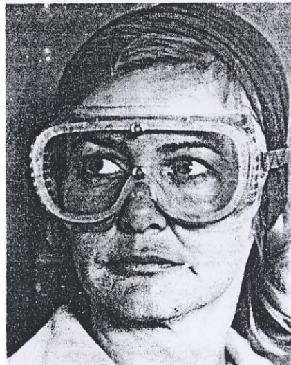
Gbr 3. Kaca Mata

berikut: mampu menutup semua bagian-bagian mata dari kemungkinan terkena bram, tidak mengganggu penglihatan operator dan yang terakhir harus memiliki lubang sebagai sirkulasi udara ke mata.