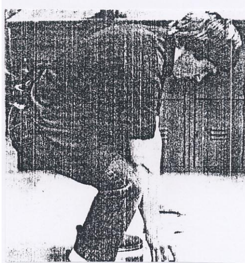
Gbr 1. Pakaian kerja