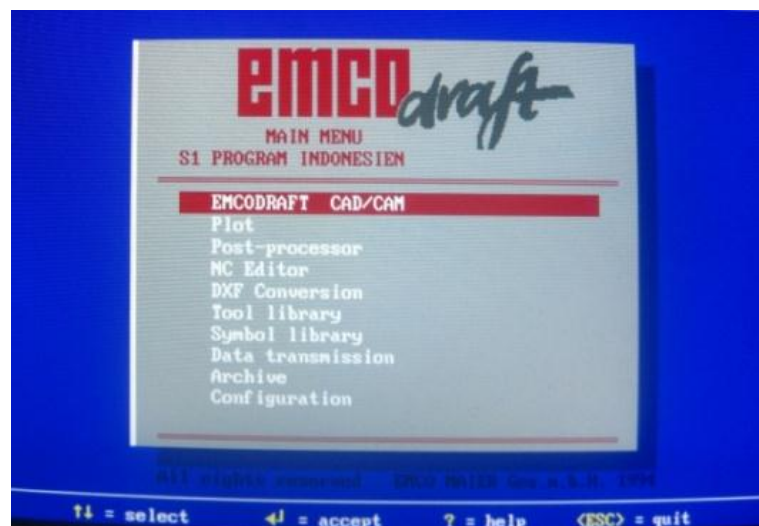
Gambar 1. Tampilan Menu Utama

Menu utama terdiri dari beberapa menu pilihan yang dapat dipilih, diantaranya dapat diterangkan pada gambar 1 berikut: