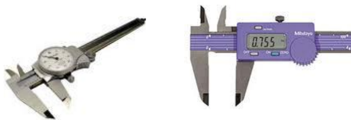
Gambar 1.2. Jangka Sorong dengan Jam Ukur dan Jangka Sorong Digital.

Konstruksi dari jangka sorong dengan jam ukur dan digital dapat dilihat pada Gambar 1.2. Untuk pembacaan dalam skala metrik maupun skala inchi konstruksinya pada umumnya sama.